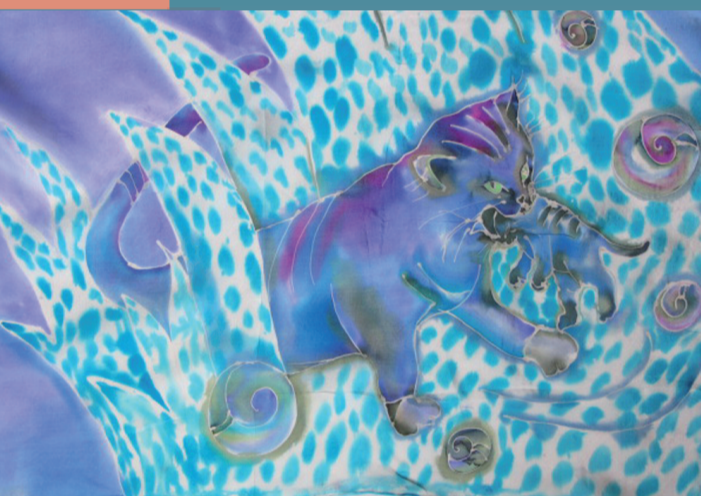
AQUARELLEN ZIJDEN SHAWLS

Van vrijdag 25 november tot en met zondag 18 december 2022.