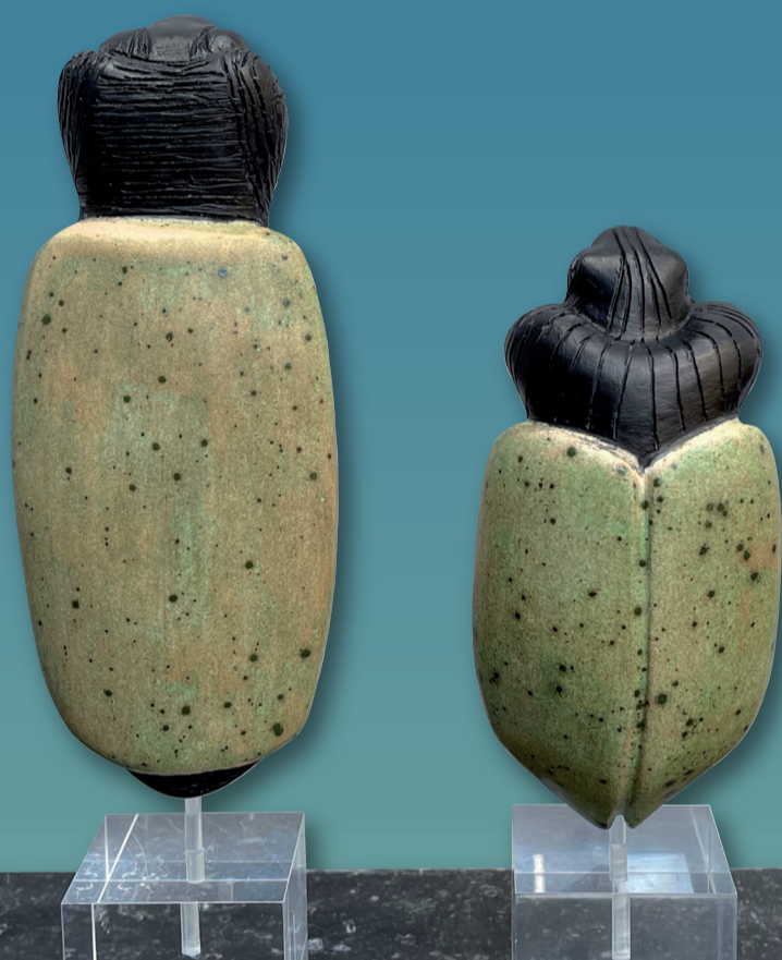
RAMONA DALES KERAMISCHE OBJECTEN