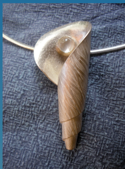
MARIA RADEMAKER SIERADEN