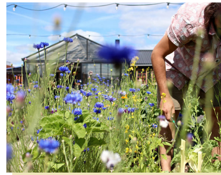
Er komt een gezamenlijke daktuin met kas