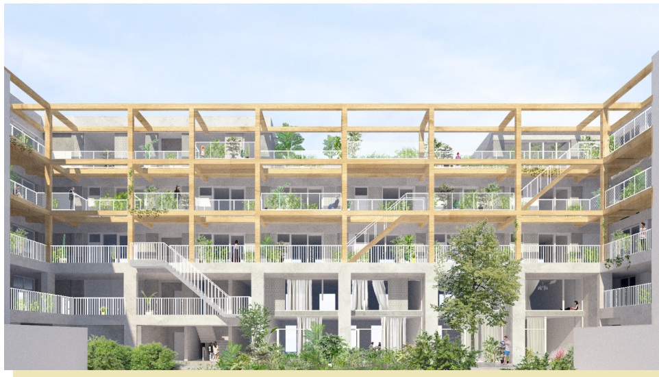
Zicht vanuit de tuin