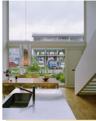
Atelier Kempe Thill, voorbeeld tuinhuis