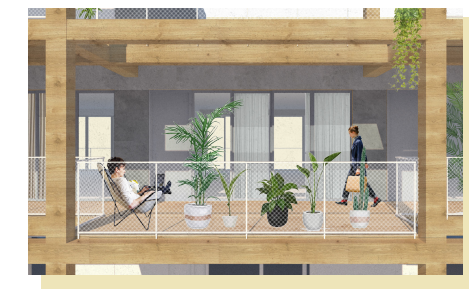
Balkon en pergola